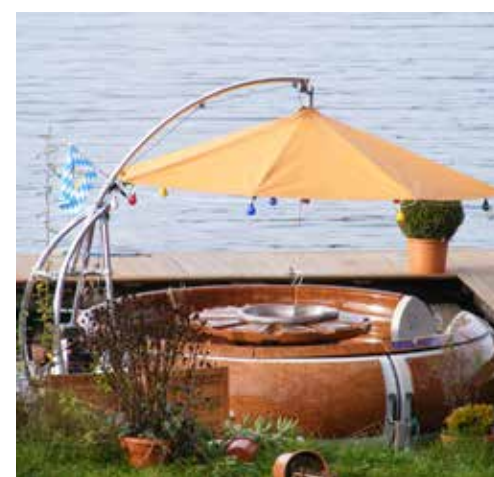
Een BBQ Donut.

Tijdens een vakantie kan het heerlijk zijn mooie stadjes of dorpjes te bezoeken zoals Dalfsen, Hardenberg en Ommen. In Hanzestad Zwolle is het