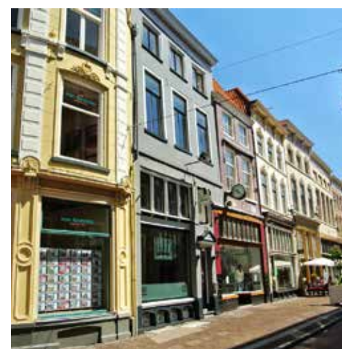
De Sassenstraat in Zwolle.

Een andere 'lekker' vakantie-uitje is aardbeienkwekerij en theeschenkerij RozemArrie in Arrien, vlakbij Ommen, een mooi gelegen plek voor een picknick-kruiswagentje: met een kruiswagen vol lekkers zoek je ergens rondom de boerderij of tussen de aardbeinvelden een mooi plekje voor de picknick. De aardbeien pluk je makkelijk zelf.