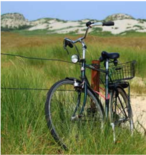
Fietsen door de duinen.