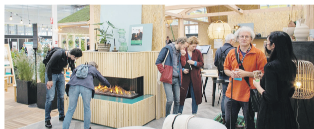
Impressie van de huis & energiebeurs

Dé beurs om inspiratie voor duurzaam wonen op te doen. Zo staat er bijvoorbeeld een levensgroot duurzaam modelhuis. Ook kunt u informatie inwinnen over producten zoals zonnepanelen, warmtepompen en isolatiemateriaal. Bovendien zijn er meer dan 100 duurzame specialisten aanwezig om u te adviseren.