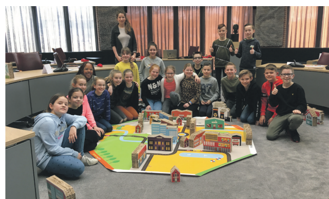
Leerlingen van basisschool de Regenboog genoten van deze leerzame ochtend

Het doel van Democracy is om samen een stad/dorp te bouwen, letterlijk. Democracy bestaat uit een plattegrond met wegen, woonhuizen en 60 gebouwen. Om het spel Democracy te spelen richten de kinderen verschillende politieke partijen op. Zij ervaren tijdens het spel dat overleg, argumentatie, meerderheid en overeenstemming nodig zijn in een democratische samenleving. Ze maken op deze manier op spelenderwijs kennis met de gemeente en democratische besluitvorming. Dit jaar zijn er 6 basisscholen uit Meierijstad die meedoen aan het spel en de dag van de Kindergemeenteraad.