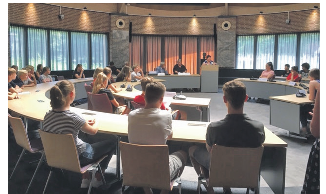
Leerlingen van het Zwijsen College tijdens de politieke jongerendagen in de raadzaal in het bestuurscentrum in Sint-Oedenrode.

Tot slot maakte de jury, bestaande uit raadsleden, bekend welke groep het beste idee had, wie de beste debater en wie de beste groepsvoorzitter was. Het waren leerzame en geslaagde dagen.