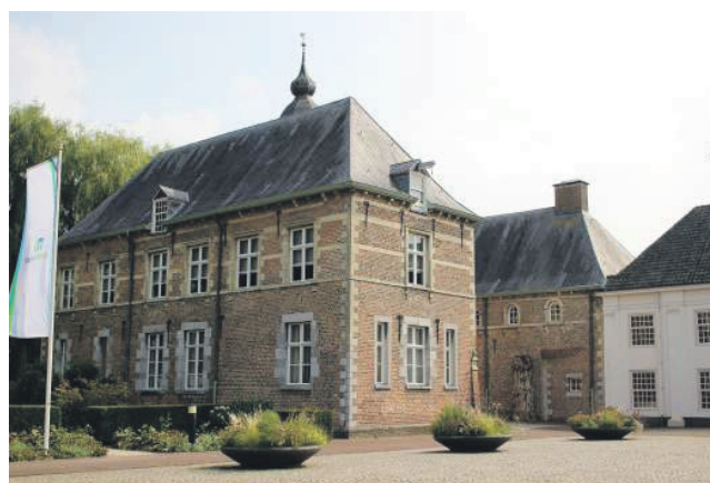
Het voormalige gemeentehuis in Sint-Oedenrode dat nu dienst doet als bestuurscentrum.

beschikbaar te stellen om twee scenario's uit te werken. Daarna wil het college een participatietraject starten met inwoners en cultureel maatschappelijke gebruikers in Sint-Oedenrode voor een goede invulling van (een deel van) het voormalige gemeentehuis. Daar worden ook de andere genoemde gebouwen bij betrokken.