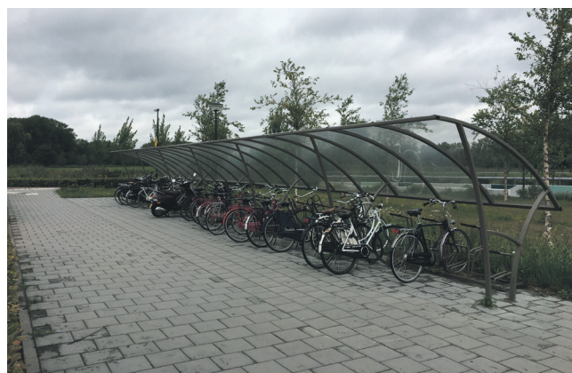
De vernieuwde halte De Beemd aan de Structuurweg in Schijndel

Afgelopen week is een start gemaakt met het aanpassen van een aantal bushaltes in Meierijstad. Als eerste is de halte Hertog Hendrikstraat aan de Nijnselseweg in Sint-Oedenrode aan de beurt. De aanpassingen dragen bij aan een betere toegankelijkheid van de haltes en een verfraaiing van het straatbeeld. Aan beide zijden van de weg komen extra en moderne fietsvoorzieningen, zodat de capaciteit past bij het aantal fietsers dat er gebruik van wil maken. Behalve deze halte worden ook de haltes op de Ollandseweg (Sint-Oedenrode), De Steeg (Schijndel), Muntelaar en Hintelstraat (Veghel) aangepast. Deze haltes zijn ingepland voor eind 2019 en begin 2020. Eerder dit jaar is de halte De Beemd aan de Structuurweg in Schijndel al aangepakt.