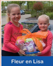
Fleur en Lisa